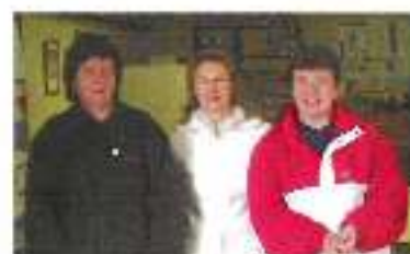
Une partie de l'intendance

En 2006, le brevet cyclotouriste, organisé par le club, a réuni 181 participants, qui ont apprécié les différents circuits fléchés.