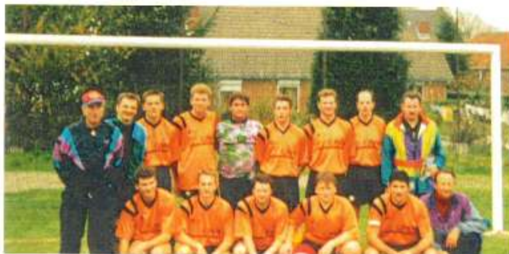
Etoile Sportive Elesmoise en 1987

Le Président, les dirigeants et les joueurs vous présentent leurs meilleurs vœux pour l'année 2007.