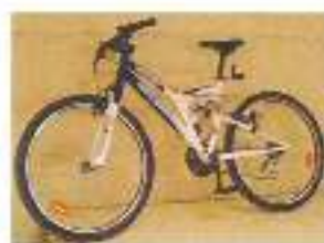
Lot de la tombola

Le 25 novembre, les membres du club et leur famille se sont retrouvés pour le repas de fin de saison, dans une ambiance conviviale.