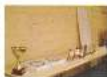
Remise des coupes