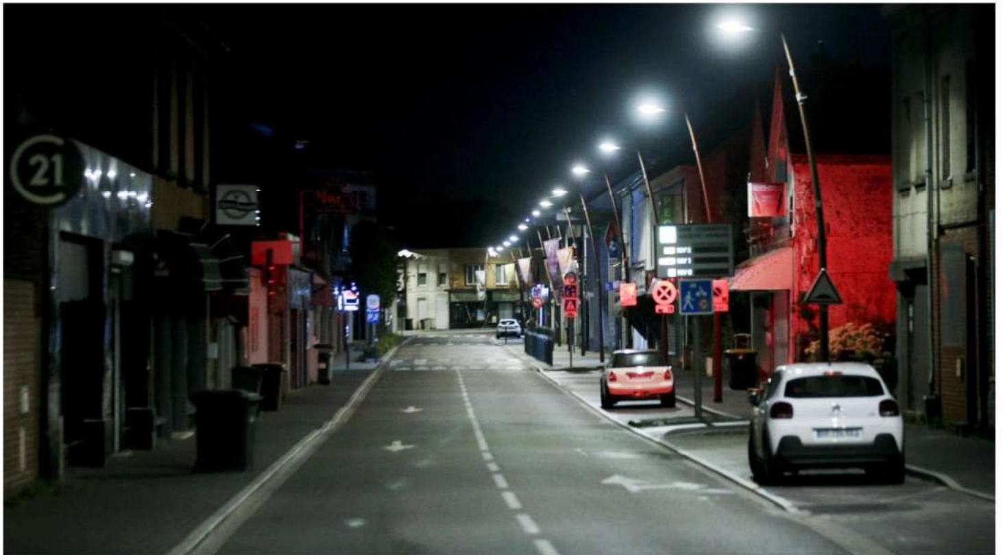
À Aulnoye-Aymeries, la rue Jean-Jaurès, rue principale du centre-ville de la commune est bien éclairée la nuit.

Éteindre l'éclairage public inutile la nuit, une question de bon sens à l'heure où le prix de l'électricité explose. La maîtrise des dépenses n'est pas le seul objectif poursuivi : biodiversité et santé humaine sont en jeu. Et même admirer la voie lactée ! Encore faut-il convaincre les élus et les habitants.