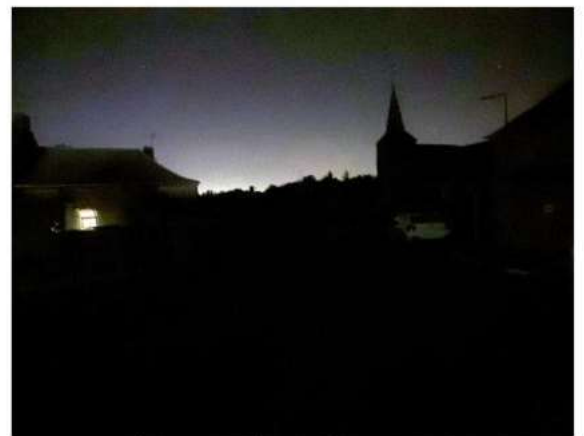
Éclaibes a choisi d'éteindre l'éclairage public dès la nuit tombée.

« On leur a suggéré de recentrer leur flux lumineux », explique Gaëlle Kania. Demande acceptée par la multinationale. Prochaine étape de sensibilisation : les nombreuses enseignes de la zone commerciale de Louvroil... ■