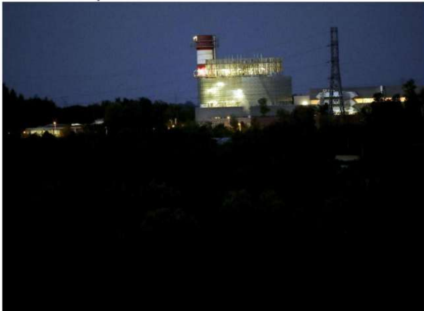
À Pont-sur-Sambre, la centrale électrique TotalEnergie a revu son flux d'éclairage pour éviter d'arroser la zone naturelle de Pantegnies.

La CAMVS s'emploie à sensibiliser les élus de ses communes, mais pas seulement. Elle a approché une entreprise privée, en l'occurrence TotalEnergie et sa centrale thermique à gaz, voisine de la zone naturelle de Pantegnies à Pont-sur-